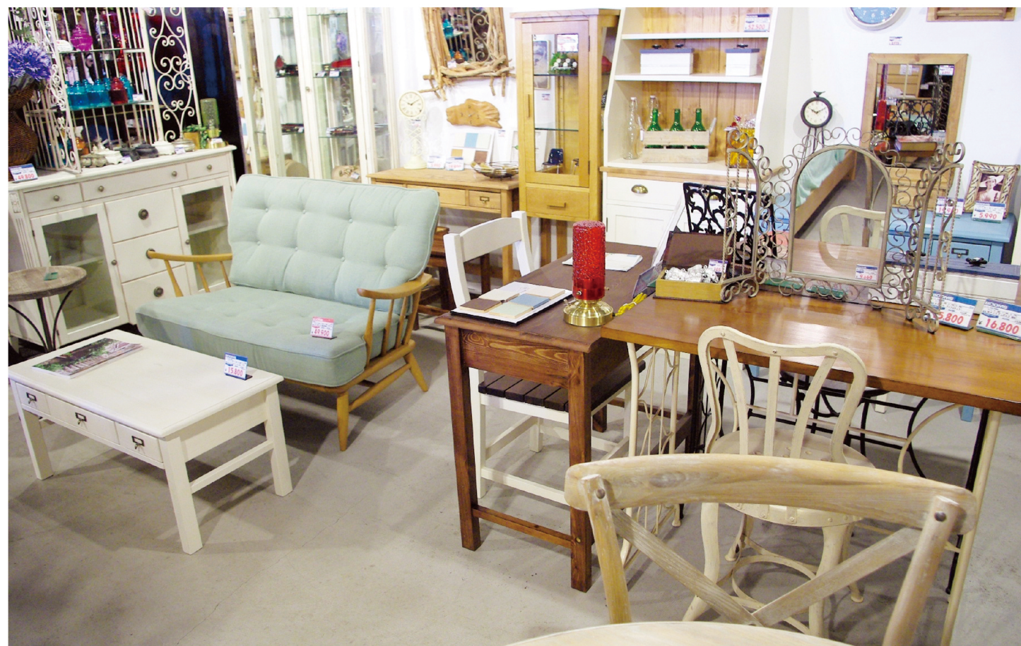
木の温もりを感じられるナチュラルな風合の家具は、実は金属やガラスなどの素材の雑貨との相性が抜群。

別館 SECRET GATE シークレットゲート TEL.0297-82-4190 取手市藤代642-2