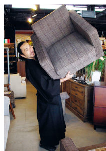
山崎代表オススメのチェア。左上/エモ2Pソファ-29,800円。右上/チェック1Pソファ-29,900円。左下/北欧の伝統的なスタイル、美しい曲木とペーパーコードの座面が特徴。しかし、イスを紹介するのになぜ持ち上げるのか...